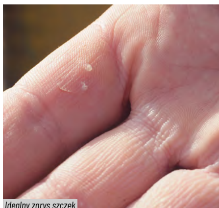
Idealny zarys szczęk