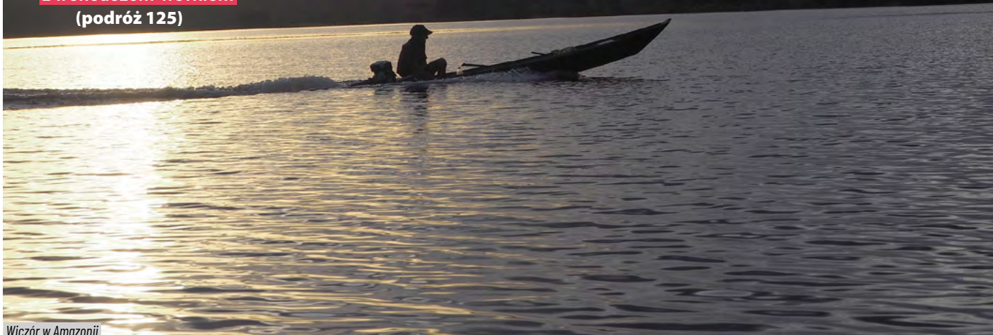
Wieczór w Amazonii

Cz. 2 Ta część jest kontynuacją 77 odcinka.