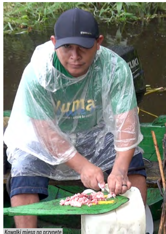
Kawalki mięsa na przynęte

Szacuje się, że w Amazonii żyje ok. 30 milionów gatunków roślin i zwierząt. Na jednym hektarze lasu znajduje się więcej odmian roślin niż w całej Ameryce Północnej. Zaledwie jedno drzewo może być domem dla ok. 80 gatunków mrówek – dwa razy więcej niż w całej Anglii. Największe zwierzę mieszkające w Amazonii to manat karaibski: osiąga ponad 3 metry długości i może ważyć nawet tonę. Razem z nim w amazońskich wodach pływa największa ryba słodkowodna na świecie. Jest to Arapaima, która osiąga 2,5 m długości i ćwierć tony wagi. Jej łuski nie są w stanie przegryźć nawet piranie. Tutaj też, charakterystyczny dla tych wód jest węgorz elektryczny. Zdarza się, że w głąb Amazonki zapuszczają się również ryby słonowodne, na przykład rekiny. Były one widziane w okolicy peruwiańskiego Iquitos, czyli aż 4 tysiące kilometrów od oceanu. Po-