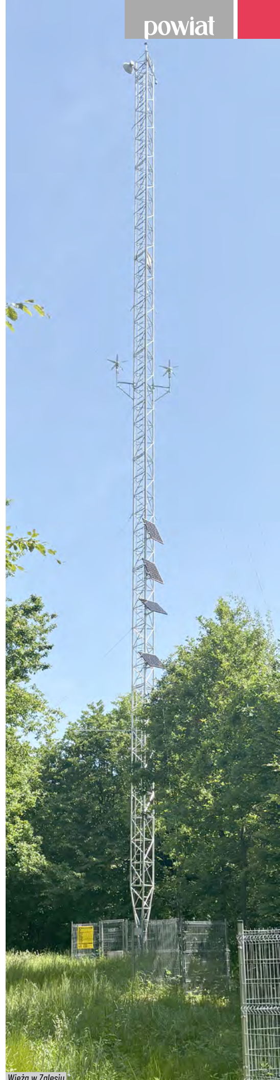
Wieża w Zalesiu