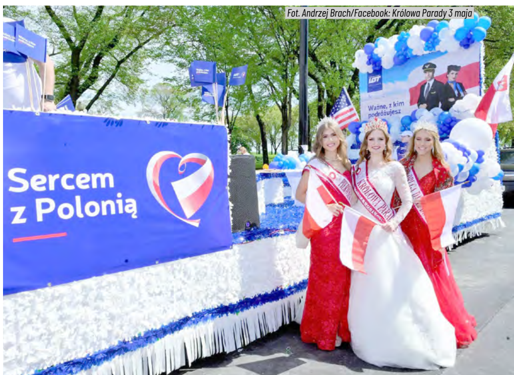
Fot. Andrzej Brach/Facebook: Królowa Parady 3 maja

Opracowano na podstawie: Express nr 8 (1580) monitorlocalnews.com