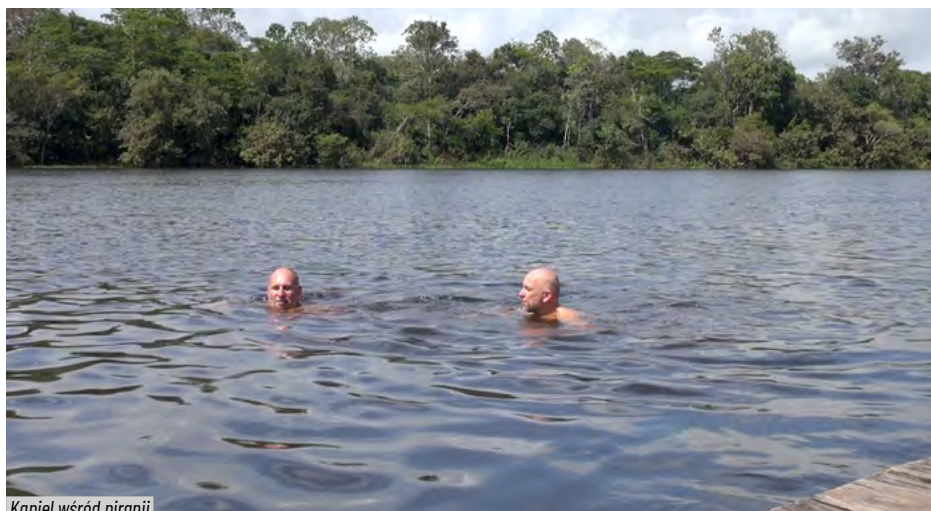
Kąpiel wśród piranii

Zapraszam do obejrzenia filmów na You Tube: Brazylia cz.2.