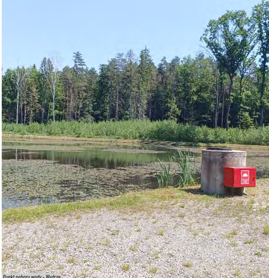
Punkt poboru wody - Wydrze

to wydłuża czas od momentu zgłoszenia do wyjazdu straży pożarnej. A my wysyłamy bezpośrednio, dajmy na to, do komendy PSP w Leżajsku. Strażacy są zazwyczaj z tych okolic i je znają, więc podajemy im dokładne współrzędne geograficzne, dokładny adres leśny plus wspomnianą pinęzkę. Ich zadaniem jest dojazd do pożaru i jego ugaszenie. Ten system współpracuje też ściśle ze stacją meteorologiczną, która jest tutaj przy nadleśnictwie. Codziennie o godz. 9.00 i 13.00 wykonujemy pomiary wilgotności ściółki leśnej. Na podstawie tego określany jest stopień zagrożenia przeciwpożarowego.