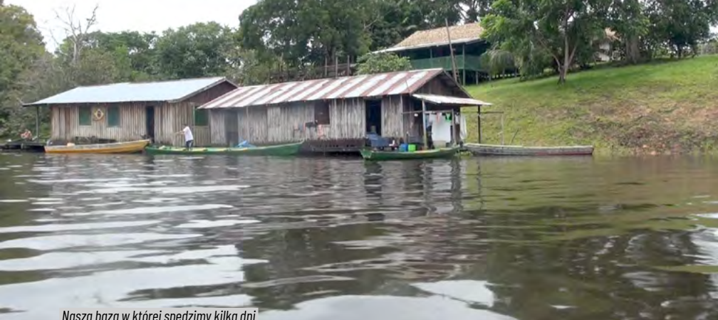
Nasza baza w której spędzimy kilka dni