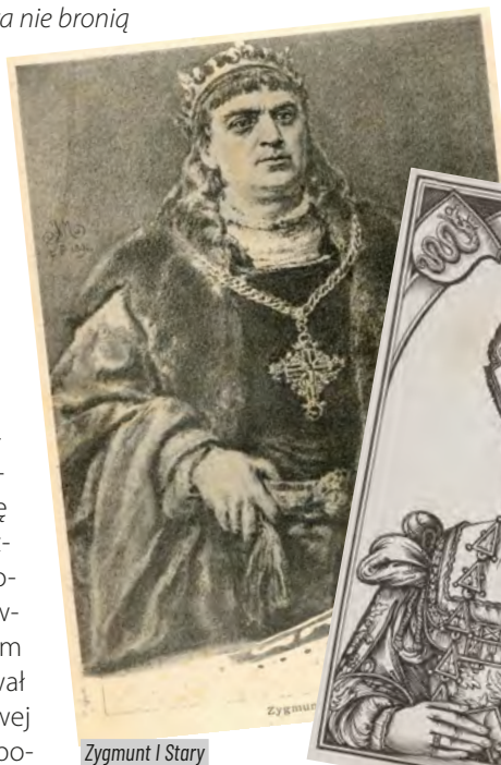
Zygmunt I Stary