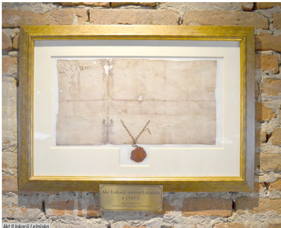
Akt II lokacji Leżajska

Lato 1524 r. przyniosło największą katastrofę w dziejach młodego starostwa leżajskiego. Tatarzy spustoszyli Ruś Czerwoną po Rzeszów. Przyczyną najazdu była tocząca się wojna węgiersko-turecka, aby uniemożliwić dostarczenie przez Polskę pomocy wojskowej Królestwu Węgier. Miasto Leżajsk zostało wówczas doszczętnie zmiecione z powierzchni ziemi, a jego mieszkańców wzięto w jasyr, wytopiwszy przedtem dzieci i starców w pobliskich bagnach. Przebywający w okolicy król Zygmunt I Stary, (w związku z wkroczeniem również armii tureckiej w granice Rzeczypospolitej), widząc ogrom zniszczenia, postanowił przenieść siedzibę starostwa w bardziej obronne miejsce. Od ocalałych mieszczan dowiedział się, że nie-