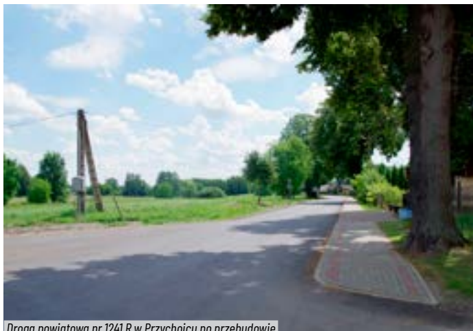
Droga powiatowa nr 1241 R w Przychojcu po przebudowie