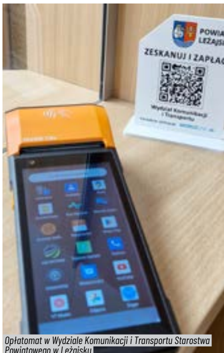
Opłatomat w Wydziale Komunikacji i Transportu Starostwa Powiatowego w Leżajsku