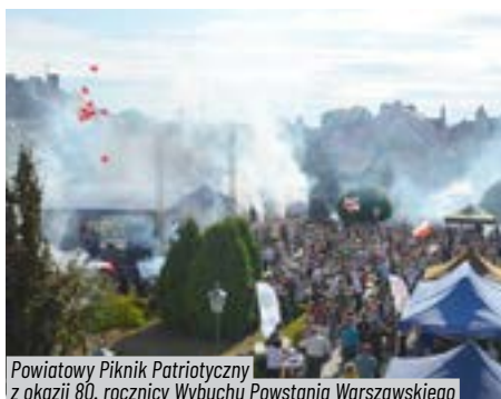
Powiatowy Piknik Patriotyczny z okazji 80. rocznicy Wybuchu Powstania Warszawskiego

Swoją działalność kontynuowała również Powiatowa Orkiestra Divertimento, która zagrała 3 koncerty: noworoczny koncert kołęd, koncert z okazji Święta Narodowego Trzeciego Maja oraz koncert z okazji rozpoczęcia lata. Ponadto orkiestra wystąpiła gościnnie w Jasielskim Centrum Kultury z repertuarem Zbigniewa Wodeckiego. Zespół jednocześnie pracował nad nowym repertuarem na 2025 rok. Powiat Leżajski doposażył orkiestrę w akcesoria muzyczne na kwotę 3 863 zł oraz złożył kolejny wniosek