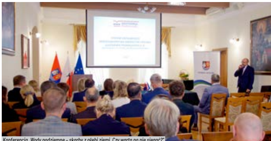
Konferencja „Wody podziemne – skarby z głębi ziemi. Czy warto po nie sięgać?”

cych w dyspozycji Ministra Sportu i Turystyki na zakup sprzętu sportowego w kwocie 49 984,00 zł w ramach Programu „Aktywna Szkoła” Wkład własny niefinansowy to kwota 12 496 zł, a całkowita wartość projektu 62 480 zł. Sprzęt sportowy zakupiono dla Zespołu Szkół Technicznych im. Tadeusza Kościuszki w Leżajsku (24 990 zł) oraz Zespołu Szkół Licealnych im. Bolesława Chrobrego w Leżajsku (24 994 zł).