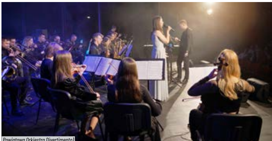
Powiatowa Orkiestra Divertimento