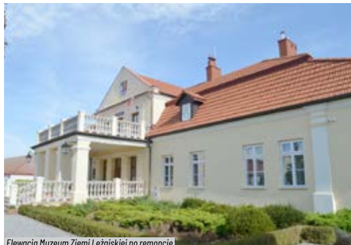
Elewacja Muzeum Ziemi Leżajskiej po remoncie