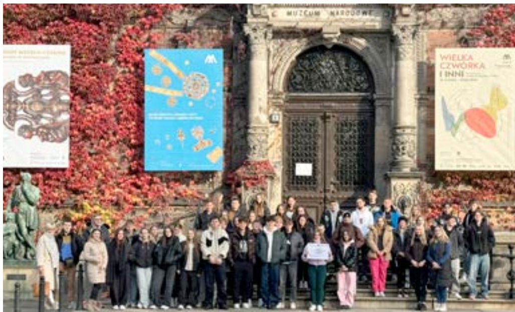
Wycieczka uczniów ZSL w Leżajsku do Wrocławia w ramach programu „Podróże z klasą”

adresowany był do byłych uczestników bądź osób chcących zostać uczestnikami WTZ, a jego celem było wsparcie tych osób w utrzymaniu samodzielności i niezależności w życiu społecznym i zawodowym; środki z PFRON to kwota 105 600 zł